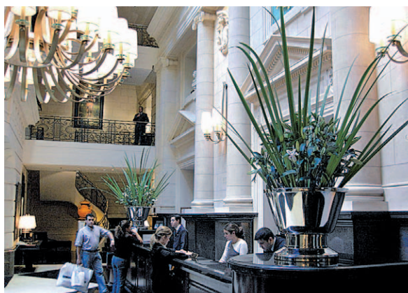
Empfangshalle im Hotel »Sofitel« Buenos Aires