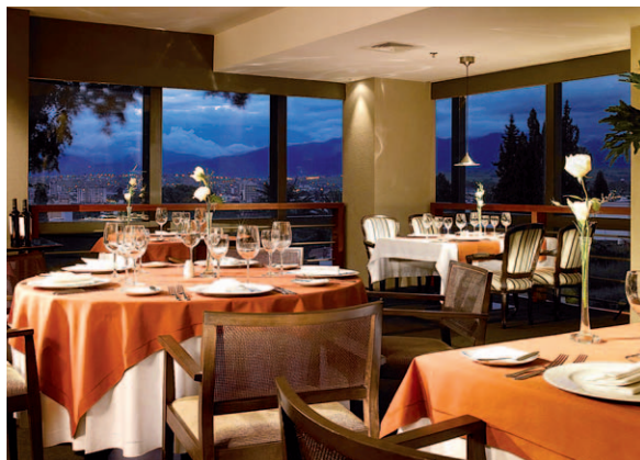
Fantastischer Ausblick: Hotel »Sheraton Salta«