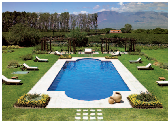
Poolanlage Hotel »Pacios de Cafayate«