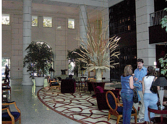
Lobby im Hotel »Park Hyatt« in Mendoza

Reisetermine Januar 2007–März 2007 18-tägige Rundreise Argentinien Reisepreis (DZ/Business Class) 7.420,- € p.P. (inkl. R+v Versicherung) Einzelzimmerzuschlag 1.620,- €