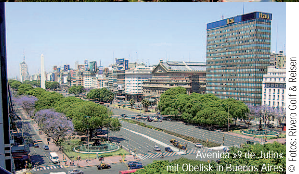
Avenida »9 de Julio« mit Obelisk in Buenos Aires