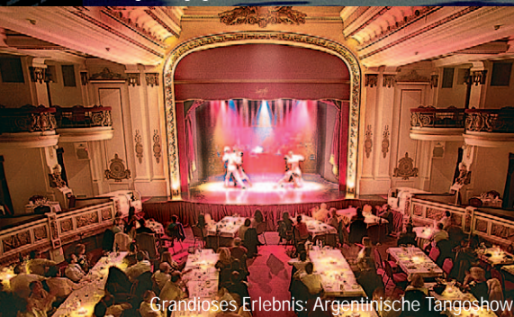
Grandioses Erlebnis: Argentinische Tangoshow