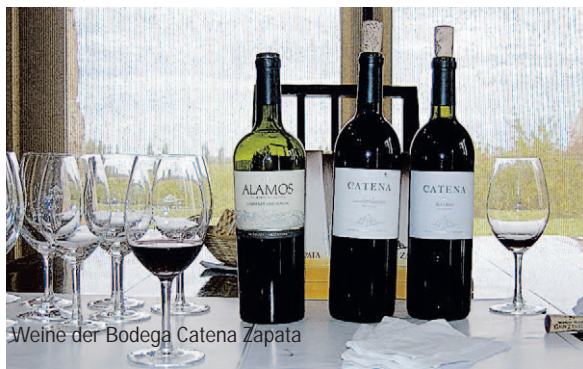
Weine der Bodega Catena Zapata