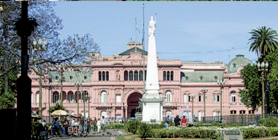
Das Regierungsgebäude »Casa rosada« in Buenos Aires